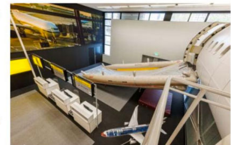
VLIEGTUIG IN AVIATION TRAINING CENTRE / ZUSTER HENNEKEPLEIN

MARS INTERIEURARCHITECTEN GELEID DOOR MARCEL VAN DER VEER WWW.MARSINTERIEUR.NL