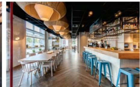
RESTAURANT HET PROEFLOKAAL / LOCATIE MAASSLUIS